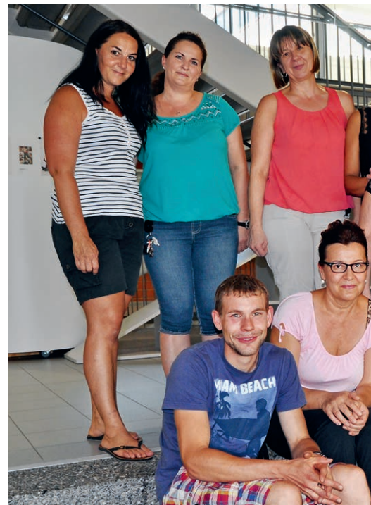
Das Team Hausdienst und Reinigungspersonal

Grosser Unterschied: Die Anwendung von (mehreren) kantonalen Computer-Programmen ist komplexer. Praktisch alles ist mit Gesetzen und Vorgaben geregelt.